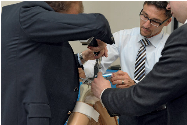
Der Kongress bietet ein hohes Maß an Wissenszuwachs in Theorie und Praxis.