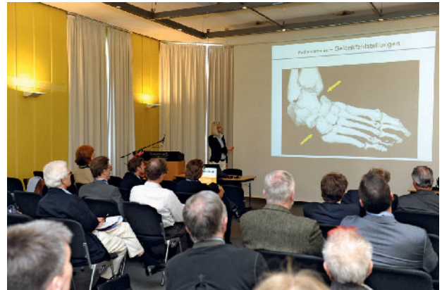
Neu ist die ASG-Akademie: Spezielle Assistentenworkshops werden von ASG-Fellows gestaltet.

die technischen Neuheiten und kann auch hier unter dem Angebot an Schulungen und Workshops auswählen.