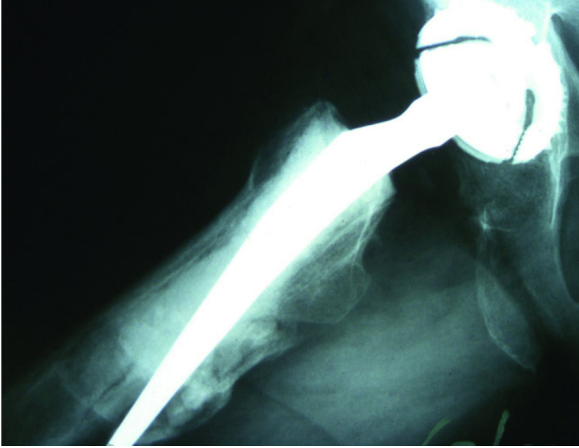
Abbildung 3 Axiales Röntgenbild einer rechten Hüfte mit Fehllage des femoralen Implantates (primäre via falsa)

re muskuläre Verhältnisse bestehen. Dies ist infolge eines degenerativen Gelenkaufbrauchs mit länger bestehender Schonung und dann auch muskulären Defiziten meist erst ab dem ersten postoperativen Halbjahr möglich. Die sportliche Vorerfahrung mit engrammierten Bewegungsabläufen ist dann sicherlich mit entscheidend. Hier hat sich folgende Differenzierung sportlicher Betätigungen durchgesetzt: