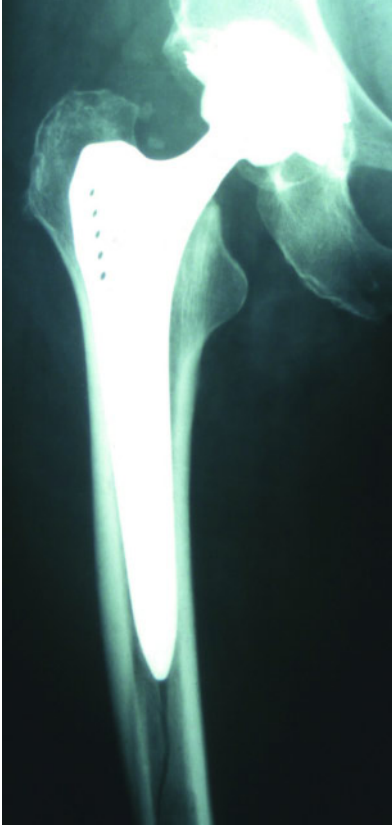
Abbildung 2 Röntgenbild einer rechten Hüfte im a.p.-Strahlengang mit intraoperativ aufgetretener Femurschaftfraktur im distalen Anteil der einliegenden TEP

ve Vorgehen ganz entscheidend. Zweifelsfrei haben hier die minimal-invasiven Techniken im Bereich des Hüftgelenkes einen erheblichen Beitrag geleistet, ob über einen posterioren oder einen anterolateralen (ALMI) Zugang [15, 16] oder über eine streng anteriore Schnittführung.