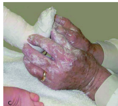
Abbildung 2c Dr. Ponseti 2004 bei der Gipsanlage eines beidseitigen atypischen Klumpfußes. Die Zeigefinger werden vor den Malleolus medialis und den Malleolus lateralis gelegt und stützen sich am Talus ab, so dass der Talus nicht in die Malleolengabel gepresst wird.