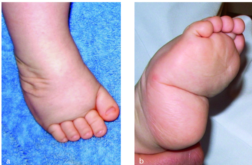
Abbildung 1 a und b Atypischer komplexer idiopathischer Klumpfuß, plumpe, kurze Fußform mit verkürztem ersten Strahl, mit plantarer querer Falte als Zeichen einer ausgeprägten Cavuskomponente

Versuch der Klumpfußkorrektur mit einer klassischen Ponseti-Redression. Die Patienten wurden zur Weiterbehandlung an unser Klinikum überwiesen. Bei allen 7 Kindern (13 Füße) waren die auswärtig angelegten Gipse gerutscht. 2 Kinder mit 3 atypischen Klumpfüßen hatten keine Vorbehandlung. Der Pirani-Score lag zwischen 5,5 und 6 Punkten ( \bar{\Delta} 5,6). Der Behandlungsbeginn an unserer Klinik lag zwischen dem 8. und 108. Lebensstag ( \bar{\Delta} 54,1). Die Gipsanzahl zur Korrektur lag zwischen 5 und 9 Gipsen ( \bar{\Delta} 6,8). In allen Fällen wurde eine perkutane Tenotomie der Achillessehne durchgeführt. Ein Fuß wurde im Abstand von 8 Wochen zweimalig tenotomiert. In einem durchschnittlichen Untersuchungszeitraum von 48,5 Monaten (36–70 Monate) kam es bei 2 Kindern mit 3 Klumpfüßen zu Rezidiven. In einem Fall erfolgte bei einem Spitzfußrezidiv eine dorsale Arthrolyse. Bei einem Kind mit bilateralem Klumpfuß erfolgte die Rezidivkorrektur beidseits mit Rezidivgipsen, dorsaler Arthrolyse und Tibialis-anterior-Transfer.