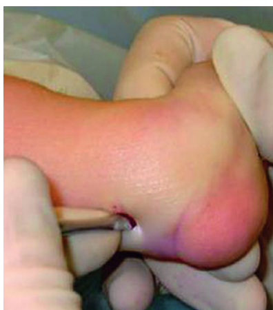
Abbildung 3 Perkutane Achillessehnenotomie im Rahmen des Ponseti-Konzeptes zur Korrektur des Spitzfußes beim kongenitalen Klumpfuß