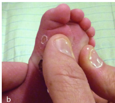
Abbildung 2a und 2b Atypischer Klumpfuß mit querer plantarer Falte. Modifizierter Redressionsgriff zur Korrektur der Cavuskomponente. Beide Daumen heben den gesamten Vorfuß und Mittelfuß an.