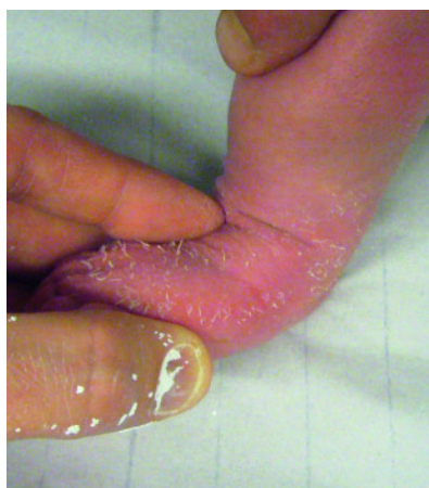
Abbildung 4 Im Gegensatz zur klassischen Ponseti-Methode, bei welcher der Fuß 70° nach Tenotomie abduziert werden soll, erfolgt beim atypischen komplexen Klumpfuß die Abduktion des Fußes nach Tenotomie nur bis maximal 40°.