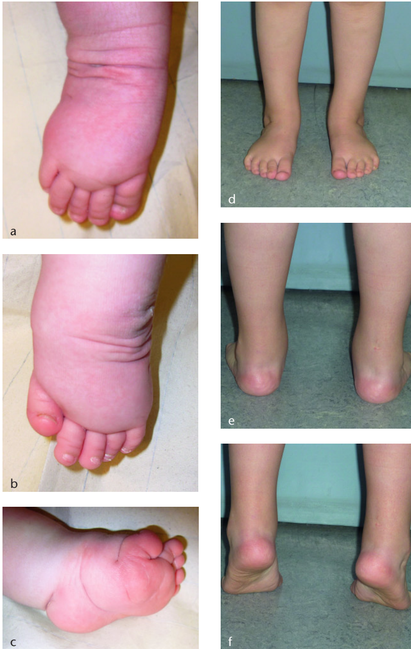
Abbildung 6a-f Fallbeispiel, beidseitiger atypischer Klumpfuß. Auswärtige Vorbehandlung mit gerutschten Gipsen. Ergebnis im Alter von 5 Jahren nach Gipsredression und perkutaner Tenotomie, rechts zweimalig, links einmalig.

den. Die Dorsalextension lag im Durchschnitt bei 17,5^\circ und die Plantarflexion durchschnittlich bei 41,2^\circ und waren damit vergleichbar gut wie die funktionellen Ergebnisse von nicht atypischen Klumpfüßen, welche mit der klassischen Ponseti-Methode behandelt wurden [5, 6, 15–17]. Die Rezidivrate lag bei einem durchschnittlichen Untersuchungszeitraum von 48,5 Monaten bei 19% (3 von 16 Füßen). Die Rezidivrate lag in der Studie von Ponseti et al. bei