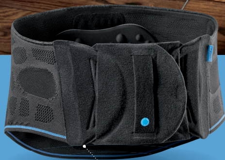
Dynamics Plus Lumbalbandage