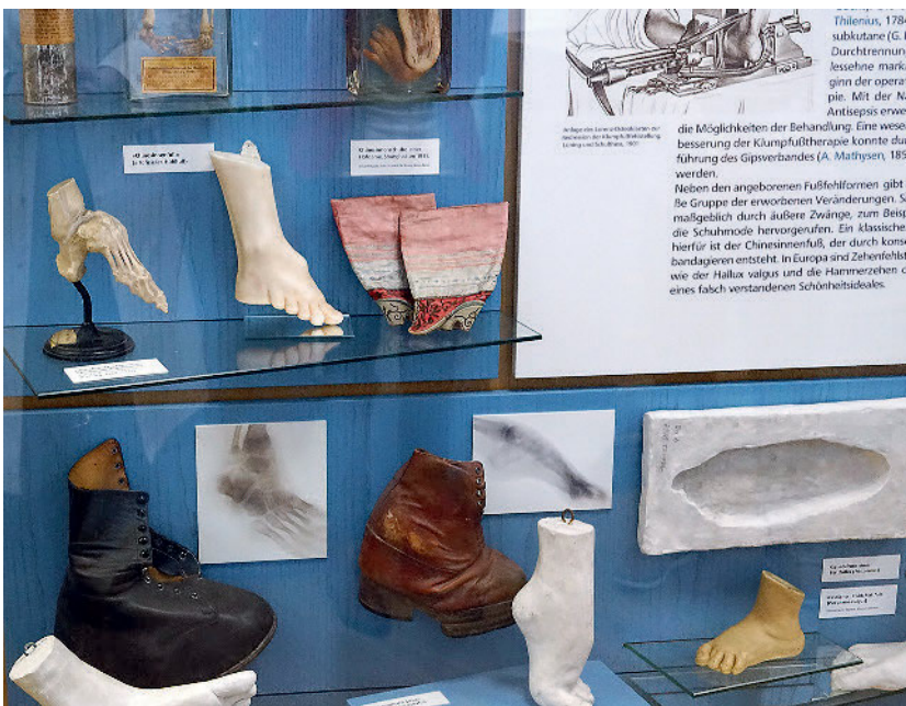
Die Orthopäden mussten sich zu allen Zeiten mit verformten Füßen und deren Heilung auseinandersetzen.