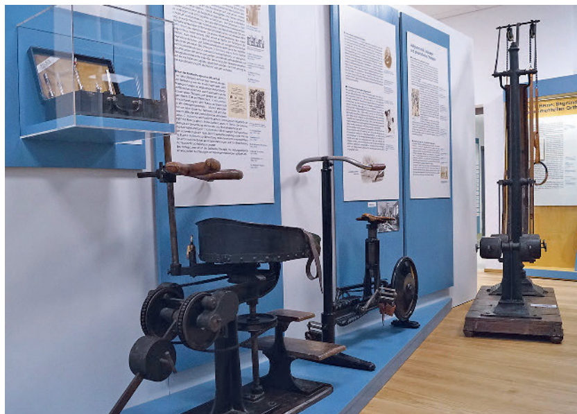
Die „historische Muckibude“ zeigt mit Original-Trainingsmaschinen, wie sich die Heilgymnastik seit 1890 entwickelt hat.

Das Deutsche Orthopädische Geschichts- und Forschungsmuseum befindet sich in der Orthopädischen Uni-