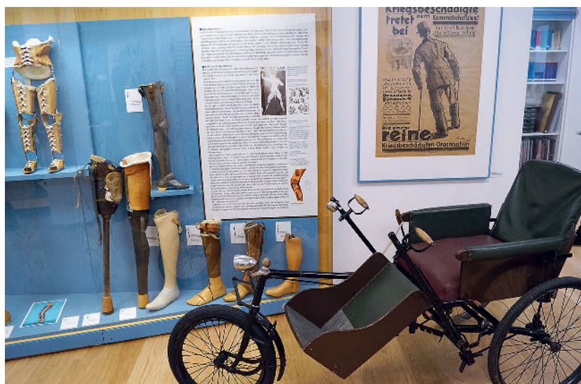
Ob Rollstühle oder Prothesenmodelle, im Orthopädiemuseum gibt es zahlreiche historische Exponate.