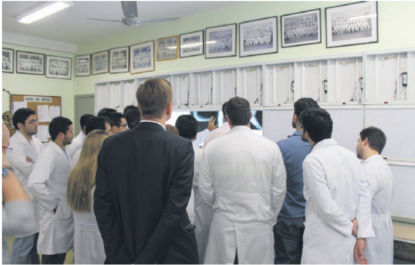
Abbildung 5 Morgenbesprechung mit Demonstration der Röntgenbilder der Nacht der Abteilung Traumatologie im Hospital Miguel Couto Leblon in Rio de Janeiro, Brasilien.

Kollegen, die trotz schwieriger Umstände, mit viel Herzblut und Freude ihrer Arbeit nachgehen.