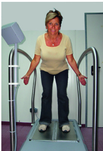
Abbildung 1 Interventionsgerät: SRT-Zeptor®Medical plus noise