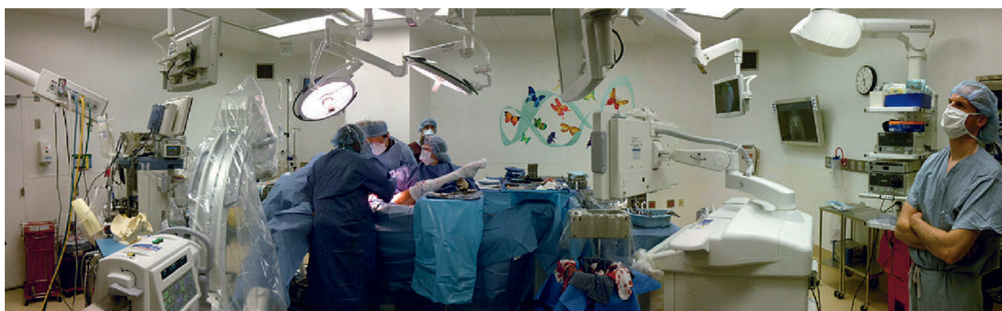
Abbildung 4 „Where kids come first“. Durch ein große Anzahl privater Spender sind die kinderorthopädischen OP-Säle am Children's Hospital of Chicago hervorragend ausgestattet.

Nach einem Abend in der Skybar mit Aussicht aus dem 94. Stockwerk über die Skyline Chicagos änderte sich die Sicht auf Amerika schlagartig aus dem Oberdeck des Amtrak-Zugs über die Kornfelder des Mittleren Westens nach Springfield, IL. Der Abstecher in die Heimat des Bürgerkriegspräsidenten Lincoln war in erster Linie ein akademischer. Den Fellows wurde die Ehre zuteil, als diesjährige „E. Shannon Stauffer Visiting Professors“ des Departments ausgezeichnet zu werden: ein besonderes Event mit Vorträgen der Fellows, sowie im Rahmen des darauf