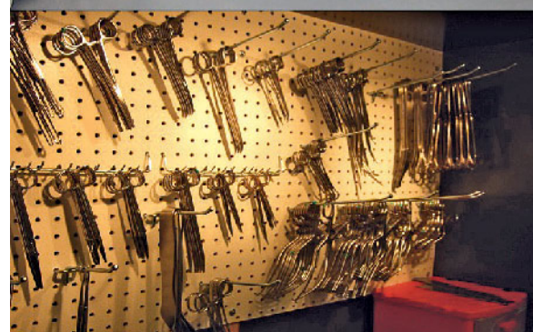
Abbildung 8 Besonders auffällig: In vielen der besuchten US-amerikanischen Institute existieren gut ausgestattete „surgical skills labs“, die den Assistenzärzten hervorragende Trainingsmöglichkeiten vor Ort bieten.