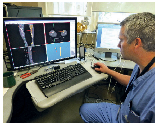
Abbildung 7 An der Queens University im kanadischen Kingston entwickelt und forscht man an orthopädischen Navigationsverfahren für die Traumatologie und Endoprothetik.

Gespannt auf die Unterschiede zwischen den amerikanischen und kanadischen Systemen flogen die Fellows nun nach Winnipeg, MB zur Jahrestagung der kanadischen Orthopädenvereinigung (COA) (Abb. 5). Auch hier wurden die Fellows im Rahmen der Eröffnungsveranstaltung offiziell begrüßt und auch hier war ein Kernbereich des Meetings das „leadership“, wobei die weitere Form der Tagung eher Symposium-Charakter hatte. Die Fellows nutzen dabei eine Vielzahl optionaler Weiterbildungsmöglichkeiten, z.B. einen eintägigen Expertenkurs an Anatomiepräparaten zur MPFL-Rekonstruktion. Vom Zentrum des Kontinents führte die Reise an den Ontariosee nach Hamilton. Dort wurden die Fellows am Sonntag von Prof. Michelle Ghert, stellvertretende Leiterin der Evidence-based Orthopaedics-Einheit an der McMaster-Universität und selbst gerade von ihrem AOA-ABC-Fellowship aus Südafrika zurückgekehrt, in einer beeindruckenden Truck-Stretchlimousine abgeholt. Bei einer