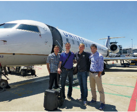
Abbildung 5 Ohne Flugzeug fast undenkbar: Die ASG-Fellows besuchten innerhalb von 6 Wochen 13 Universitäten und 2 nationale Kongresse in England, den USA und Kanada.